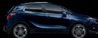
Bleu Lune marine